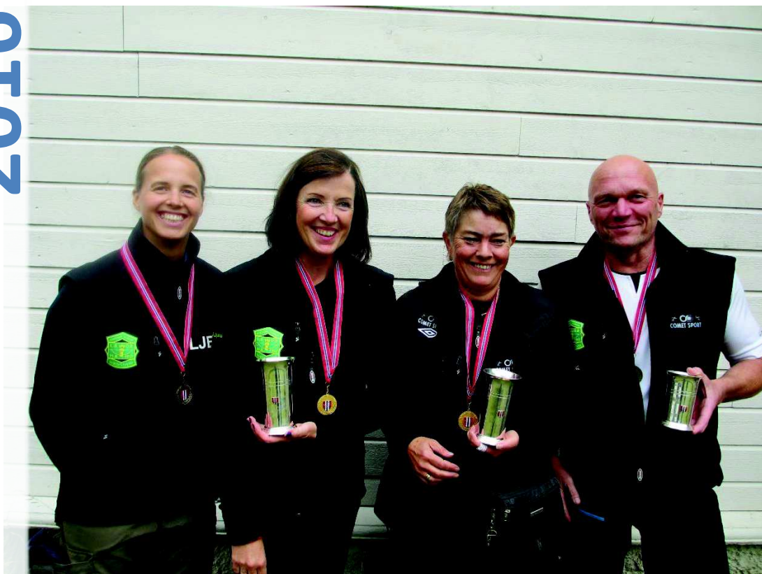
NM 3D 2016