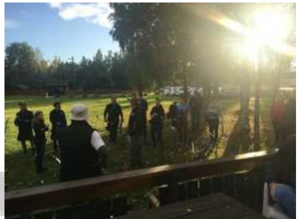
Flott sosial klubbmesterskapskveld